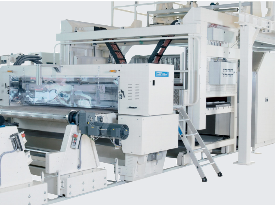
Die Anlagen von Maschinenfabrik Herbert Meyer sind äußerst komplex. Teilweise sind bis zu 15.000 Dokumente erforderlich, um sie komplett zu beschreiben.

fließen automatisch in die Datenwelt und Prozesse von APplus ein. Vertrieb bzw. Einkauf sowie Konstruktion können Artikel im ERP erzeugen und nach Freigabe an das PDM transferieren. Andererseits kann die Konstruktionsabteilung Stücklisten und Teile im PDM automatisch generieren und an das ERP übergeben. CAD-Daten und -Zeichnungen inklusive ihrer PDFs können sie in PRO.FILE sauber verwalten.