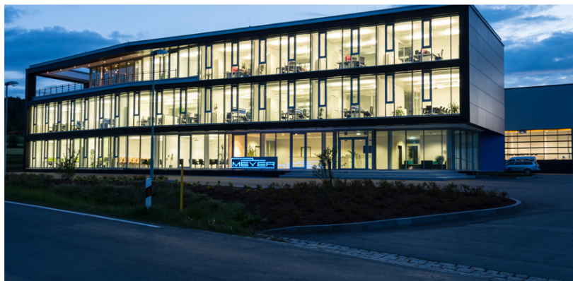
Moderne Arbeitsplätze, durchdachte Arbeitsabläufe und zeitgerechte IT-Lösungen sind Teil des Erfolgs in der Maschinenfabrik Herbert Meyer

Meyer ist einer der führenden Hersteller von Maschinen, die unterschiedliche Materialien verbinden bzw. verkleben. Das Know-how des Unternehmens kommt in vielen Branchen und Anwendungsfällen zum Tragen. So findet man Meyer-Maschinen in der Bekleidungsindustrie, bei der Herstellung technischer Textilien, bei Automobilzulieferern, in der Medizin, bei Schuhherstellern, in der Lederverarbeitung, bei Skiherstellern u.v.m.